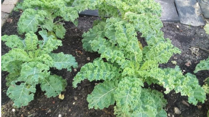
boerenkool uit de moestuin tuintje 50