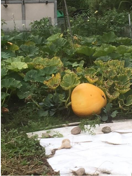
Tuin nummer 108

Ze kunnen heel groot worden, tot wel 600 kg. De pompoenen heten Atlanta. ( dat vertelde de eigenaar van tuin 147)